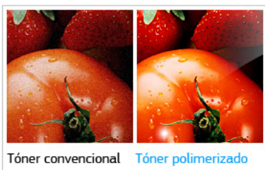
Tóner convencional Tóner polimerizado